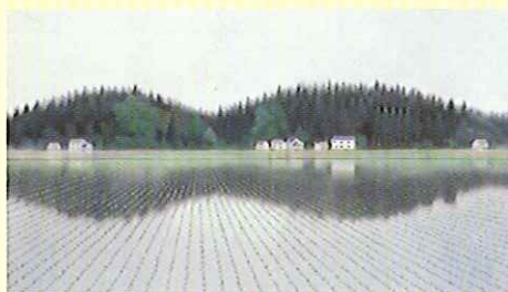
▲「ふる里へ」 小学館