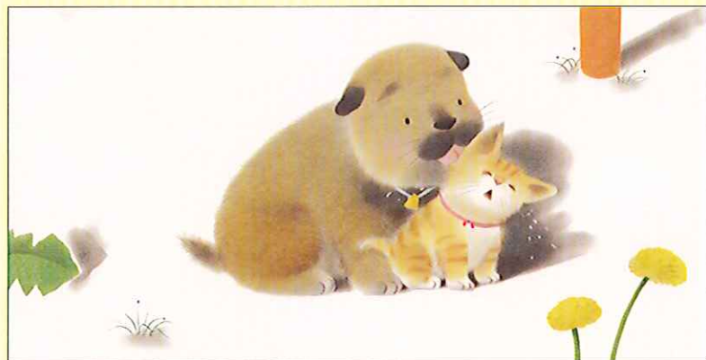
▲「ころわんはおにいちゃん」 ひさかたチャイルド © KEN OFFICE, 1986

2014年 4月19日(土) - 6月1日(日) 会期中は無休：入館時間 午前10時～午後5時30分(閉館は午後6時)